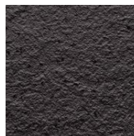
Riga Pattern+ Rock