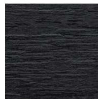
Riga Pattern+ Slatewood