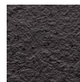
Riga Pattern+ Rock