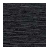
Riga Pattern+ Slatewood